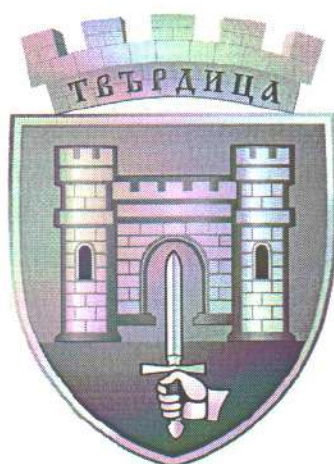
3. Stema orașului Tvardița, districtul Sliven, Bulgaria.

Emblema principală proprie a stemei și drapelului orașului Tvardița este cetatea heraldică bastionată de plan pentagonal cu funcție de armă grăitoare. Putem vedea o cetate, dar în altă ipostază, întruchipând însă aceeași idee, chiar în stema orașului bulgar Tvardița (fig. 3).